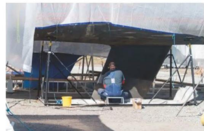
Påskhelgen är den stora båtfixarhelgen.