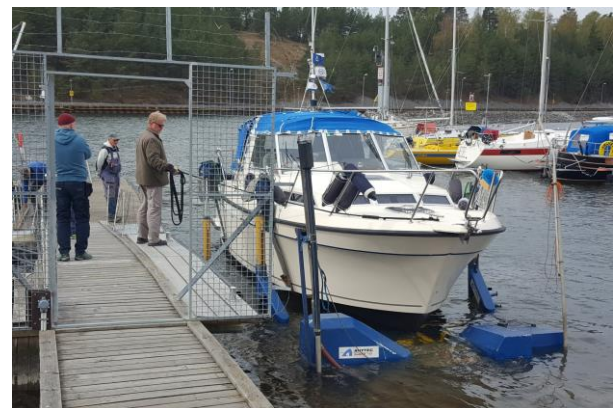
Från sjösättningen 2022 (Anders H). Snart är det dags igen!