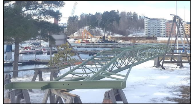
Nu: Som en död dinosaurie (association till den som finns på Naturhistoriska riksmuséet. /Lars K)

De vardagslediga (numera de sju plus 3 nya plus en ännu nyare!) var som vanligt flitiga under 2022. Bland de arbeten som nämns i verksamhetsberättelsen är dykningar på A+B-bryggorna, reparation av Y-bom på A-bryggan, tillverkning av ny trappa till toatömningen och tillverkning av ljugarbänkar på klubbhuset. På Radön tillverkning av ny landgång till bastun, dörrparti till dansbanan och ditfrakt av bojstenar.